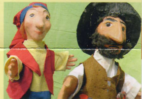
Der Räuber Hotzenplotz

16.30 Großer Saal Ab 5 Jahren Theater im Ohrensessel Der Räuber Hotzenplotz Nach dem Buch von Otfried Preußler Regie: Ernst Reepmaker Idee und Spiel: Stefan Libardi